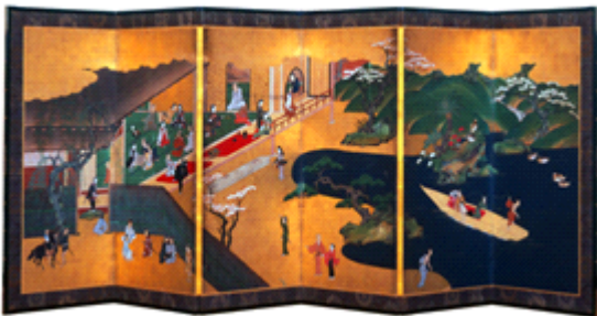
静岡県指定文化財 伝 岩佐又兵衛 作

近世の風俗画の中で、広い妓楼の邸内や庭を高い所から見、様々な享樂のあり様を描き込んだ、一連の風俗画の一つです。大きな池で舟遊びや、座敷内には、囲碁・かるた・釣りあるいは踊りを踊る姿等々。江戸時代の風情が面白おかしく描かれています。特に金雲や地面には金箔が押されます。また、金泥の衣文線や柱の木目描写の偏好などにも、この種の風俗画との共通点が見られ、その流れに位置する作品としても貴重です。日本の古典的大和絵の描写を見事に描かれ、彩色、金箔等よく保存され着物等の絵柄が細かく残っています。