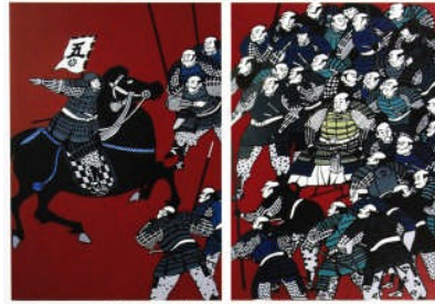
三方原合戦徳川軍図 版画 光山房

浜松文芸館 中区鹿谷町11-2 25年12月7日から 26年3月2日まで 入場無料 月曜休館